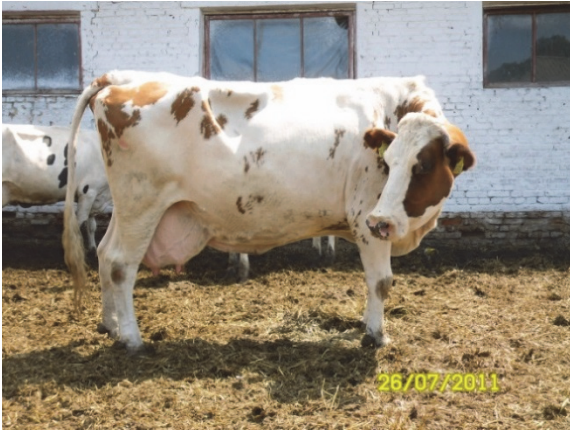
1. Корова-рекордистка УЧер породи з постійної групи донорів ПАТ «Полтаваплемсервіс»: проведено 6 позитивних циклів вилучення ембріонів (5 якісних ембріонів/цикл) після вибуття з дійного стада (6 лактацій).