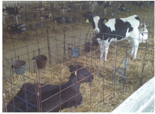
2. Група телят молочного віку в приміщенні – ангарі ПрАТ «Агро-Союз»: серед них – телята-трансплантанти від донорської групи вибракованих корів з молочною продуктивністю 12 000–14 000 кг за кращу лактацію.

Висновки. В зв'язку з тим, що аналіз рівня відтворення генетичних ресурсів кращих корів різних стад виявив негативну тенденцію до постійної елімінації з генофонду вітчизняних молочних порід цінних генотипів жіночих особин за традиційного методу репродукції – штучного осіменіння, для практичного застосування представлена перспективна можливість отримання додаткових дочок-трансплантатів від високопродуктивних корів-донорів після їх вибуття з дійного стада.