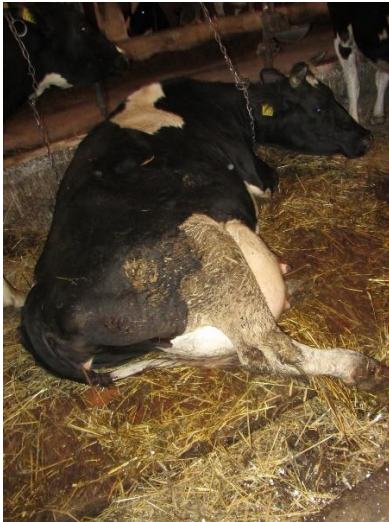
Витікання кров'янистих лохій в перший тиждень після отелення