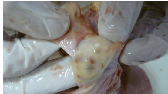
Залишкові жовті тіла