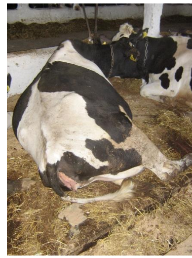
Витікання лохій з домішками гною