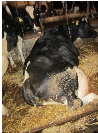
Витікання густих лохій